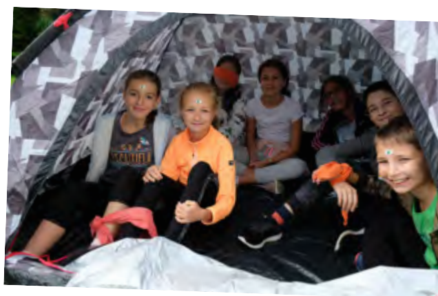
Seznamovací kurz primy