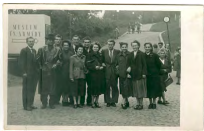
Slovácký kroužek v Praze 23.9.1954

Moc děkuji za otevřené vzpomínání a doufám, že naše čtenáře zaujalo. Zajímá mne, pokud to není tajemství, kde jste se seznámili s manželem. Můj manžel bydlel v Držovicích s maminkou. Jeho otec, který pocházel z Komně, byl poštovním doručovatelem, zemřel při náletu 30. 4. 1945 při výkonu služby v Prostějově. Obec Komňa leží mezi Bojkovicemi, Nivnicí a Starým Hrozenkovem, to už je začátek Karpat, lidově se tomuto kraji říká Kopanice. Komňané jsou hrdi na to, že v jejich obci se údajně narodil J.A. Komenský. Stejný nárok na jeho občanství si ale dělají i v Nivnici. Zda je tento spor vyřešen, to opravdu nevím. Tento kraj