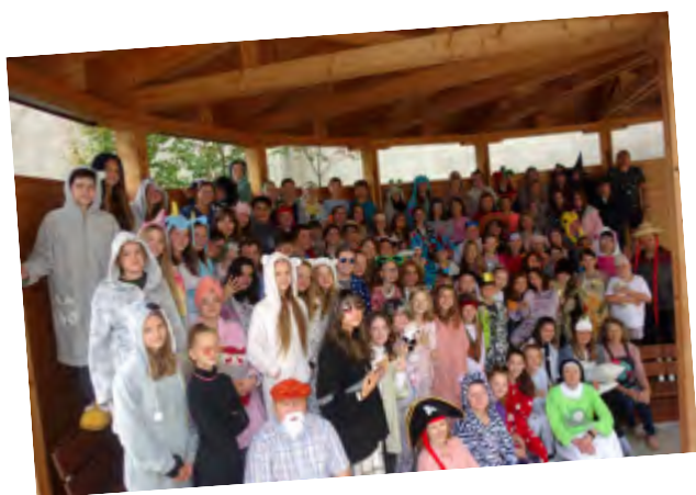
Mezinárodní den úsměvu