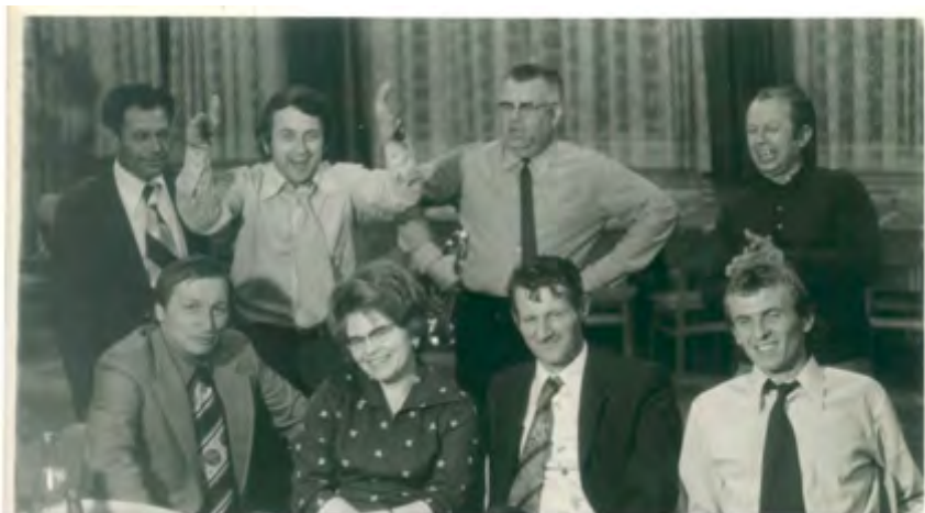
Setkání v práci

Náš časopis INRI vychází první adventní neděli, měli jste prosím nějaké zvyky na tento čas u vás v rodině? Přivezla sis je do Prostějova?