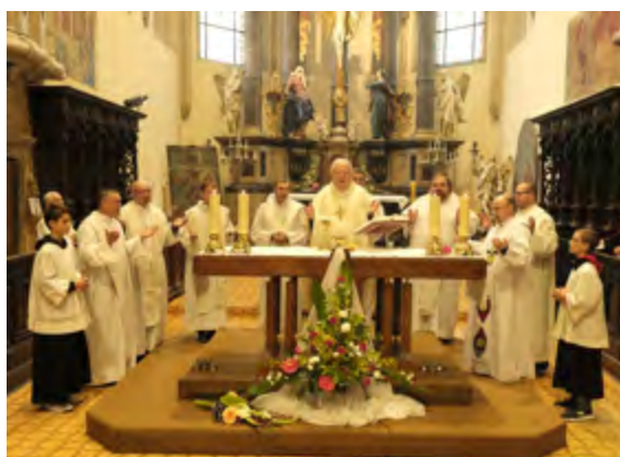
Slavnostní děkovná mše sv.

První čtvrtletí školního roku je za námi a s potěšením si prohlížíme bohatou kroniku, která doplňuje náš vzdělávací program. Studenti prožili adaptační a osobnostní kurzy na Staré Vodě, absolvovali různé exkurze a přednášky. Zúčastnili se, s malými či většími úspěchy, různých soutěží a sportovních utkání. Společně jsme oslavili 30. výročí školy.