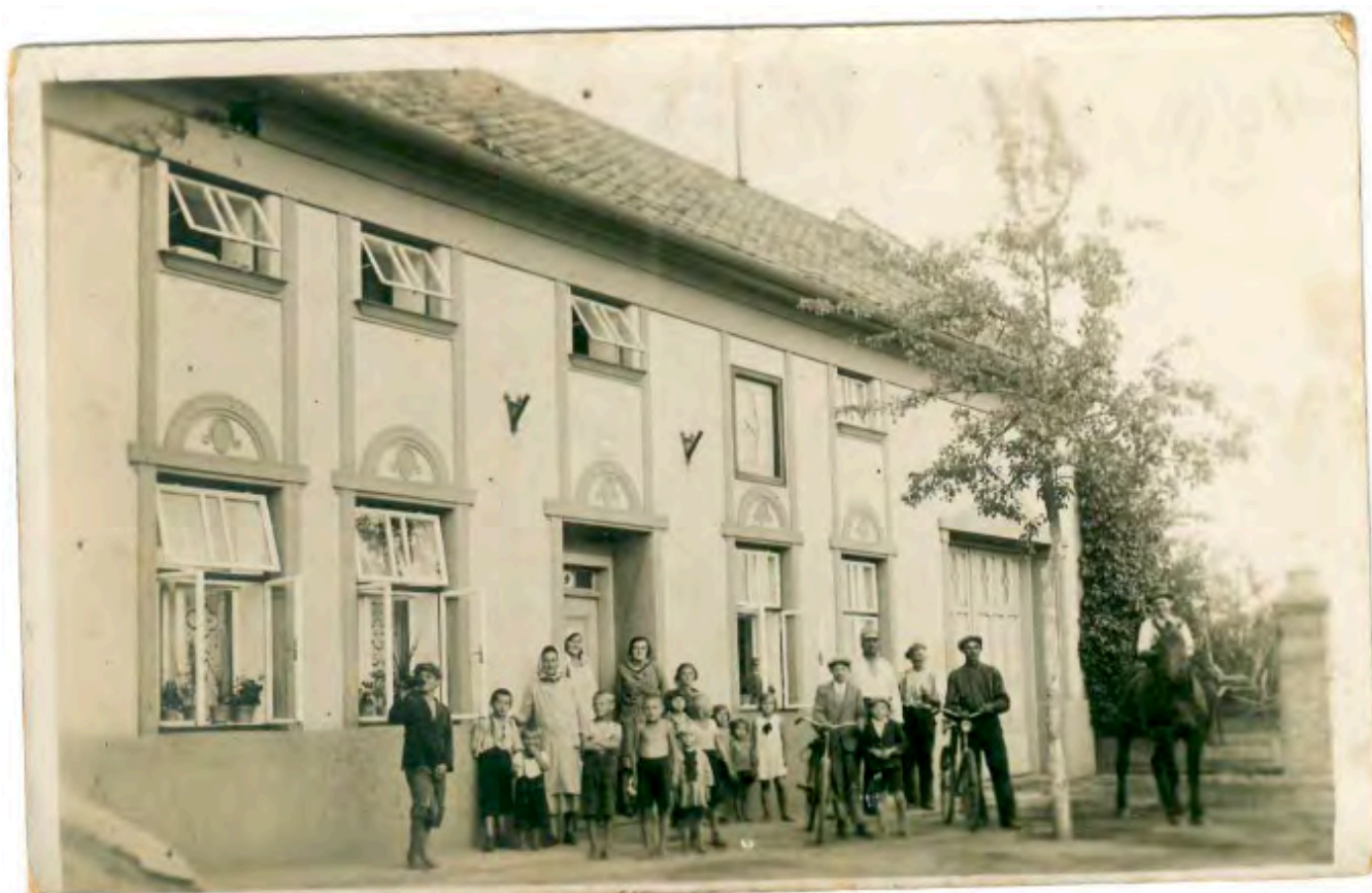
Dům pana starosty v Poličce

Pro nás mladé nebylo mnoho nabídek zábavy. Tu jsme si museli opatřit sami. Kdo rád zpíval, měl možnost v pěveckém kroužku, kdo rád cvičil, zapojil se do znovu obnovené působnosti Sokolské organizace. Byla vytvořena skupina Junáka. Od obce nám byla přidělena místnost jako klubovna. Vedli nás starší, někteří i otcové rodin se svými malými dětmi. Vzpomínám si, že jsem byla dle věku asi v 8 letech zařazena do oddílu „Vlčat“. Moc mne to bavilo. Plnili jsme bobříky, jako například: bobřík odvahy, síly, pravdomluvnosti, slušného chování. Pak jsme chodili na pochodová cvičení, zdolávali překážky, plnili drobné úkoly, které jistě měly vliv na náš další vývoj i charakter v utužování kamarádství.