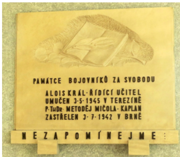
Pamětní deska ve škole na Husově nám. v Prostějově.

14 Připomínáme si sedmdesát pět let od smrti kněze Metoděje Jaroslava Mičoly https://www.prostejov.eu/redakce/index.php?clanek=179953&lanG=cs&slozka=126990 (staženo 18. 3. 2022)