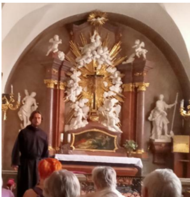
Vranov u Brna.

Stinný odpočinek ve sluncem zalitým odpoledni nám poskytla farní zahrada, kde proběhlo společné ukončení naší poutě. Osvěžila nás výborná limonáda z jablečného sirupu z místních produktů. Rozdělili jsme se o poslední zásoby a shodli jsme se, že to bylo opravdu pěkné, celý den. A už nás čekala cesta domů. Tu jsme oslavili zpěvem lidových písní tu veselých, tu táhlejších a smutných, tak jak to život přináší a jak nám naši předci v písních zanechali.