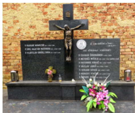
Hrob salvatoriánů v Prostějově.