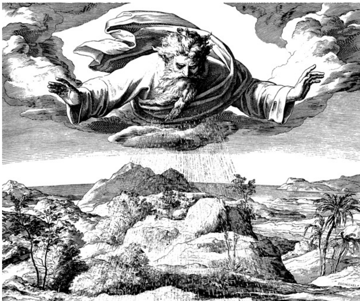
Třetí den stvoření. Julius Schnorr: Bible v obrazech, 1860

* V neděli 22. 9. jste také zváni v 17 hod. na farní zahradu u petrské fary (Třefa, Lidická 1a) na Ekumenické setkání s bohoslužbou tematicky zaměřenou na Boží stvoření .