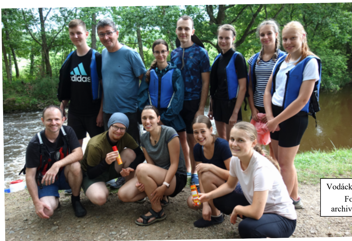
Vodácký tábor.