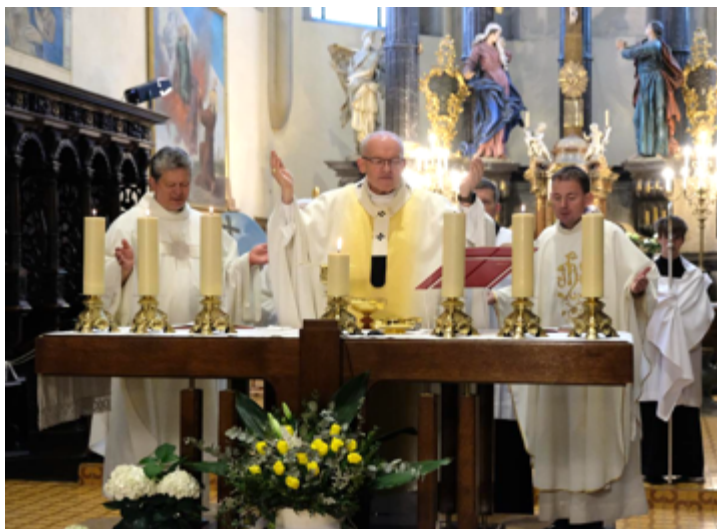
Závěrečná mše sv.

studentů, rodičů a učitelů v neformálních rozhovorech, plných sdílené radosti a vděku za úspěšné zakončení jedné velké životní etapy.