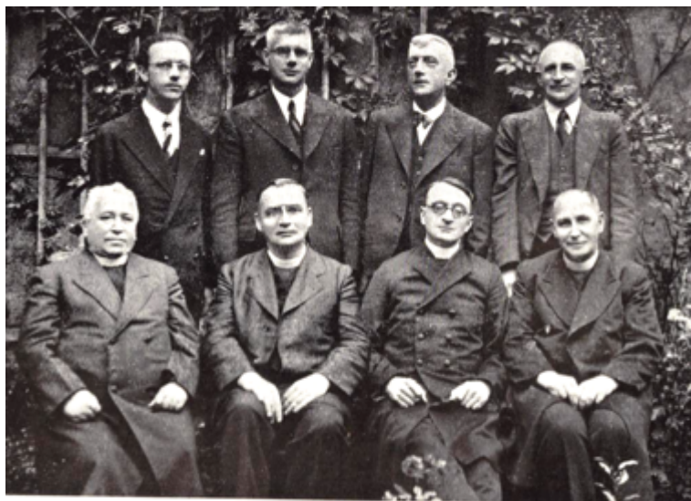
Pracovní výbor DLU v jubilejním roce 1938-1939